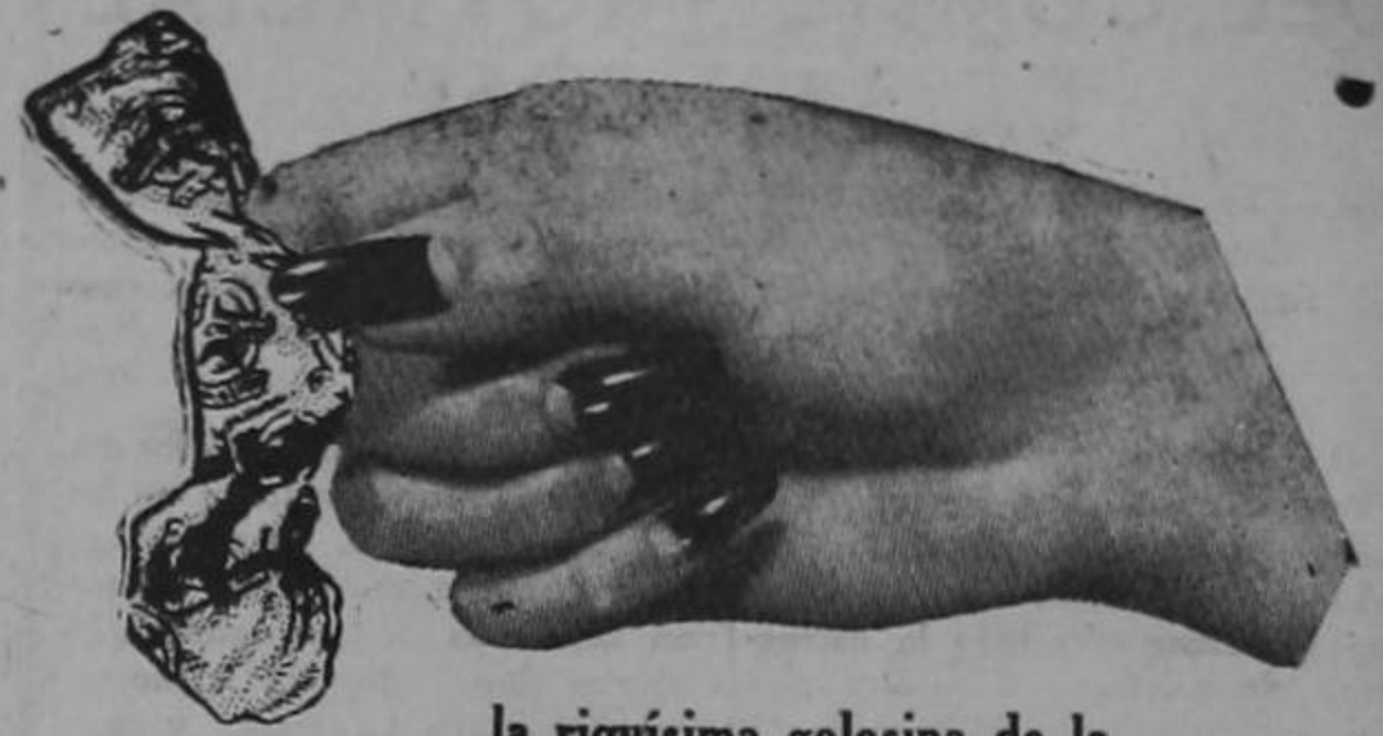
la riquísima golosina de la